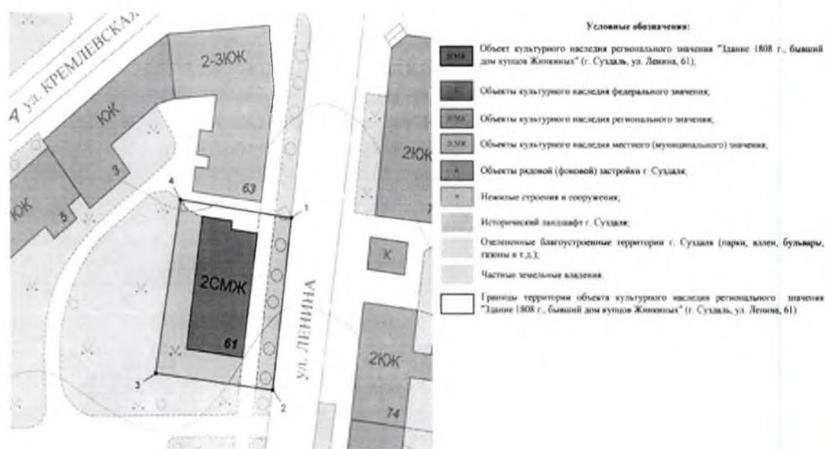
Координаты поворотных (характерных) точек к карте (схеме) границ территории объекта культурного наследия регионального значения «Здание 1808 г., бывший дом купцов Жинкиных» (Владимирская область, город Суздаль, ул. Ленина, д. 61)